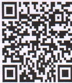
แสดกน QR code